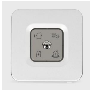
Lecteur de clés