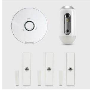
Offre | Offre de 1 détecteur de fumée ou 1 détecteur photovolumétrique ou 3 détecteurs magnétiques