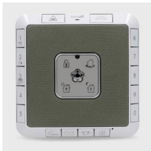
Panneau de commande