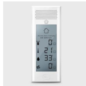
Alarme anti-inhibition Sentinel (équipement valable uniquement au Portugal continental)