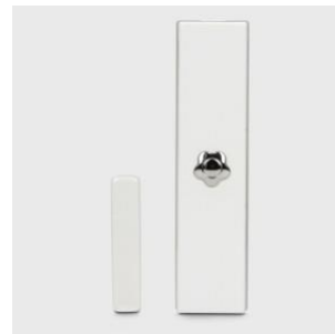
Détecteur magnétique - détecteur de vibrations (Capteur de choc)