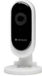
Offre | Caméra Cloudcam Pro