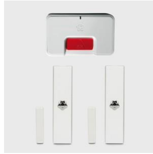
Offre | Bouton anti-attaque et détecteurs magnétiques - détecteur de vibrations (chocs)