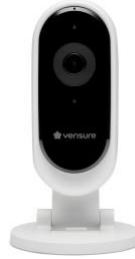
Offre | Caméra Cloudcam Pro